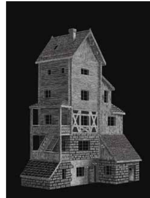
Simon De Castro